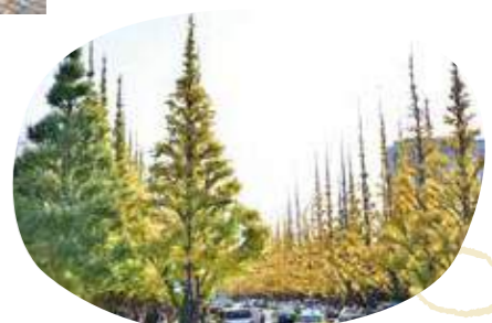
散策やスポーツが楽しめる

新宿御苑や各地の国立公園の情報を発信する施設が2020年オープン。各地の公園の情報や、日本の調度品、アート作品を見ることができます。 新宿区内藤町11 新宿御苑インフォメーションセンター内 ☎03-3350-0151 ◎9:00～16:30(季節により変動有り) 休新宿御苑休園日