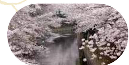
川面を染める桜は圧巻

ドッグランや、区内でも大きめの遊具などがある広々とした公園。園内には池があり、生き物を見ることができるかも。間近で電車が通るのも見られるので、電車好きにもおすすめです。 新宿区中井1-14 ☎03-5273-3914 [MAP P.12-13] A-3