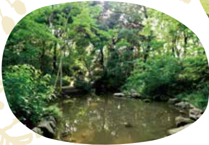
江戸時代は徳川家の狩猟地