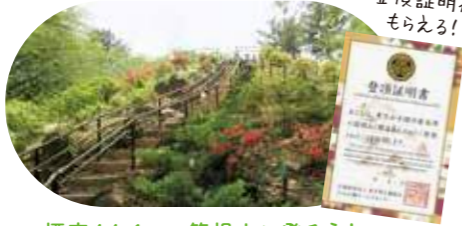
標高44.6mの箱根山に登ろう!