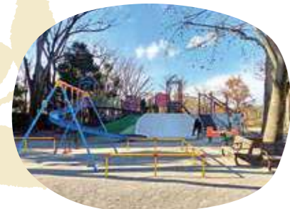
妙正寺川沿いのお散歩におすすめ

落合崖線に位置する緑地公園には、武蔵野のかつての雑木林の姿が残っています。中央部には湧き水でできた池があり、天気の良い日は、亀の甲羅干しやカモが見られることも。 新宿区下落合2-10 ☎03-5273-3914 ◎4月～9月/7:00～19:00 10月～3月/7:00～17:00 [MAP P.12-13] D-3