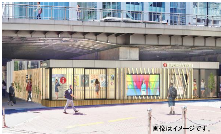
画像はイメージです。

※カテゴリー3とはJNTO（日本政府観光局）が定める外国人観光案内所認定制度において、常時英語対応可能なスタッフ・英語を除く2以上の言語での案内・原則年中無休・Wi-Fiあり・ゲートウェイや外国人来訪者の多い立地などの条件を満たして認定されます。