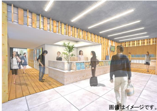
画像はイメージです。